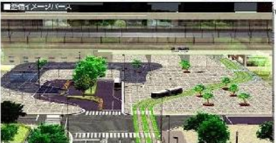
路面電車新幹線『筑豊くらて駅』(仮称)前